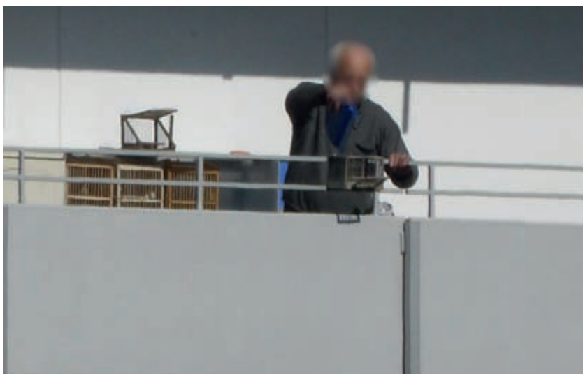
Vogelfang mitten im Ruhrgebiet: Dieser Mann stellt auf seinem Balkon in Mettmann illegal Stieglitzen mit Käfigfallen nach.

9.4.2015.