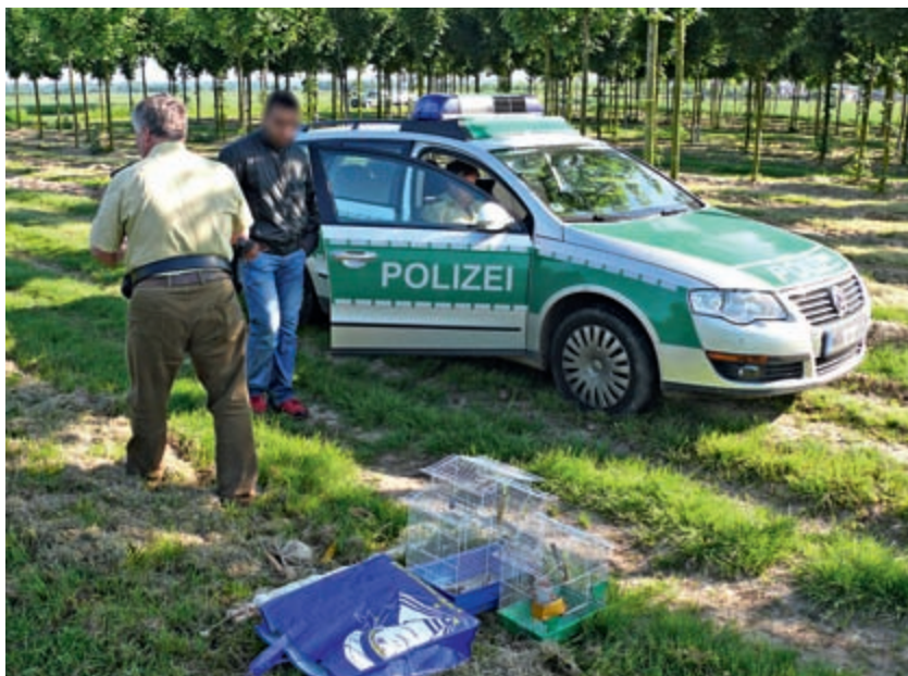
Dieser Vogelfänger wurde nach einem Hinweis des Komitees beim Fang von Stieglitzen in einer Birnenplantage bei Bonn auf frischer Tat erwischt. 23.5.2009.