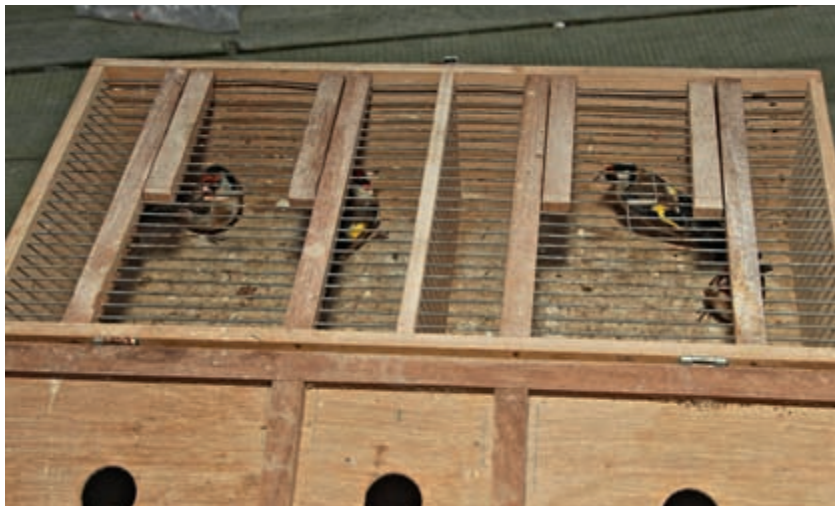
Diese Stieglitze wurden von einem Händler aus Oberhausen für 60 Euro pro Stück im Internet angeboten. 25.11.2015.

Neben Verkaufsangeboten entdeckten die Komitee-Mitarbeiter auch Annoncen, in denen mit zweifelhaften Methoden nach Singvögeln gesucht wurde. „Suche dringend Erlen- und Birkenzeisige zu erschwinglichen Preisen. Gerne auch Tiere ohne Ring“, so der Text einer Anzeige aus dem Januar dieses Jahres. Eher kurios mutet dagegen folgende Annonce an: „Tausche Häckenschere nagel neue gegen pärcchen vögel stiglitz“ (Ebay-kleinanzeigen.de, geschaltet am 16.10.2015) – das Angebot kam von