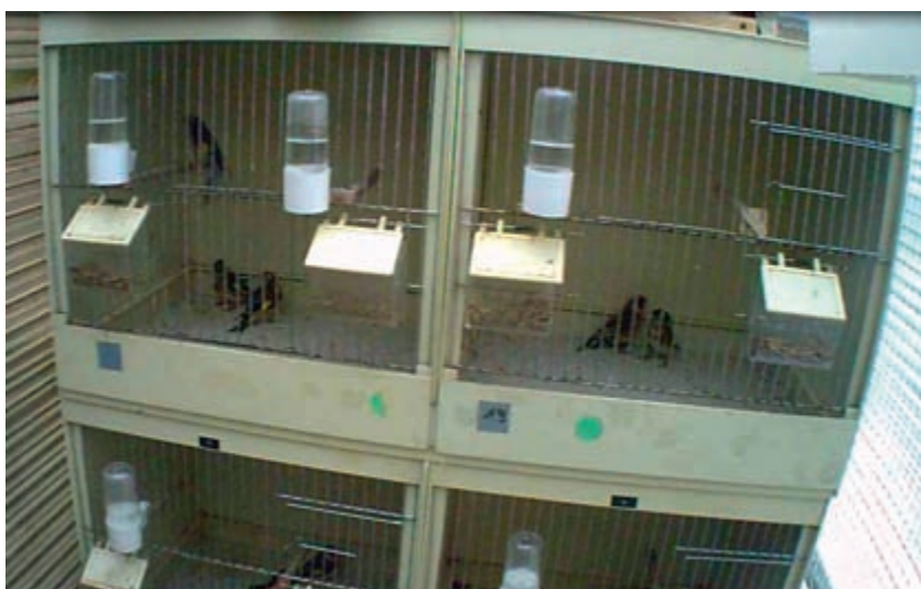
Das „Lager“ eines Stieglitz-Verkäufers aus dem Ruhrgebiet, hier wurden 15 unberingte Vögel entdeckt und sichergestellt. 25.11.2015.