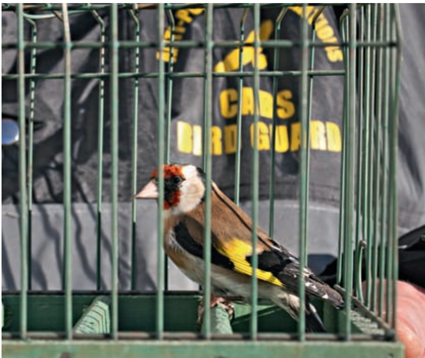
In Köln beschlagnahmter Stieglitz.